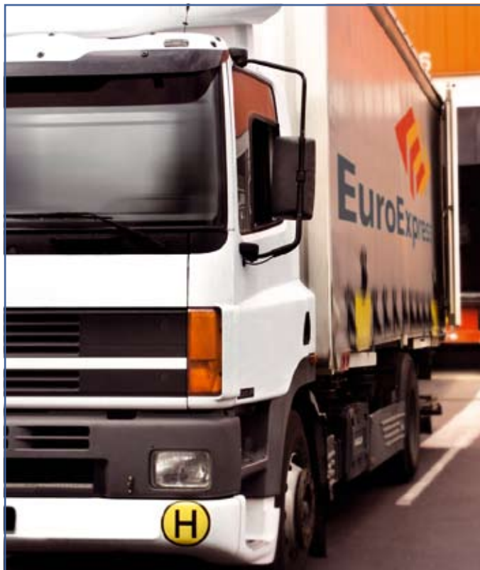
EuroExpress ist erster Ansprechpartner, wenn es um Schnelligkeit oder Sonderservice geht

Der Geschäftsbereich Euro Express gliedert sich in drei Felder: Der Express-Zustelldienst ist ein flächendeckender 24/48-Stunden-Service zwischen 14 Ländern Europas, der durch ein ausgeklügeltes System von Nachsprungzeiten Laufzeiten garantiert, die so teils nicht