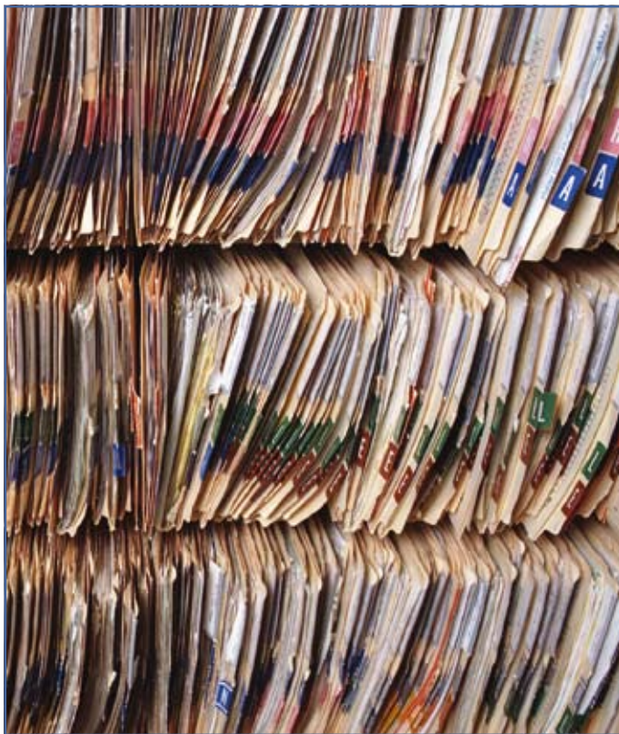
Dokumentenlogistik sorgt für Ordnung im Dokumentenprozess

Optimierung der multimedialen Arbeitswelt mit ihren Dokumenten aus Papier und elektronischen Dateien